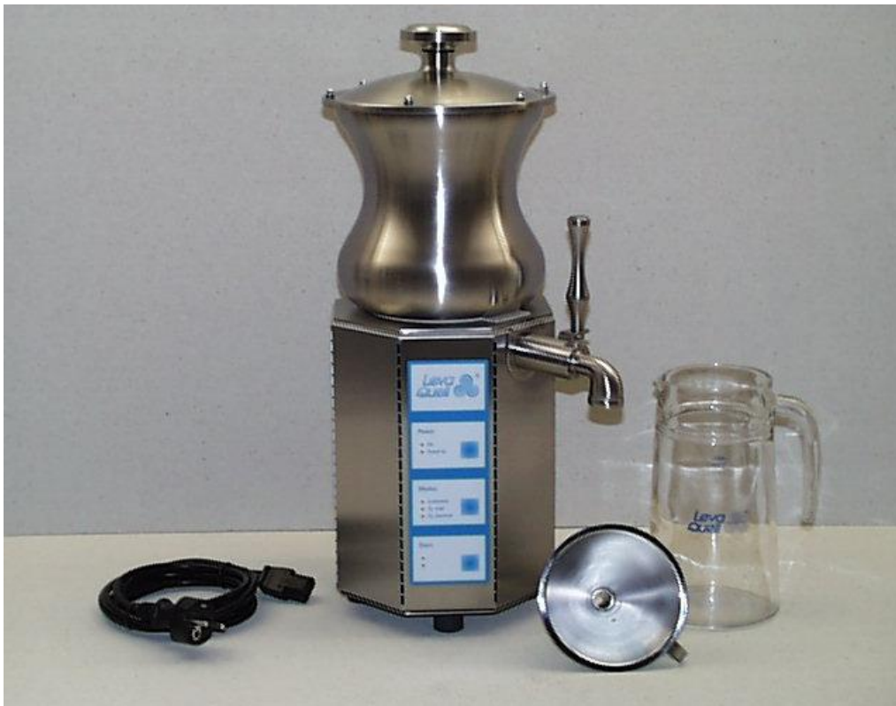
Leva Quell- Levitationsanlage 2,25 L

Um der Trinkwasserverordnung zu genügen, muß Wasser heute vielfältig technisch behandelt werden. Dabei geht nach unserer Auffassung ein großer Teil der Energie verloren. Überwiegend ist Trinkwasser heute eine saubere Flüssigkeit, die jedoch die natürliche und ursprüngliche wassereigene Energie, wie z. B. bei Quellwasser, verloren hat.